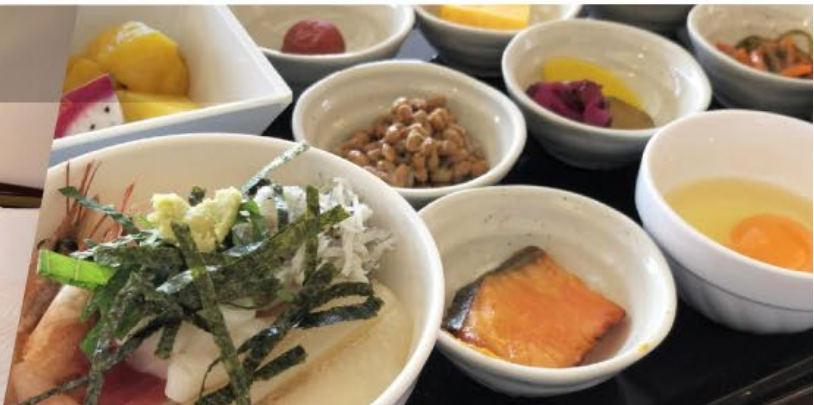
👑 ROUTE INN 二本松溫泉飯店