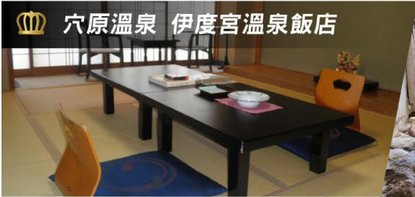
👑 穴原溫泉 伊度宮溫泉飯店